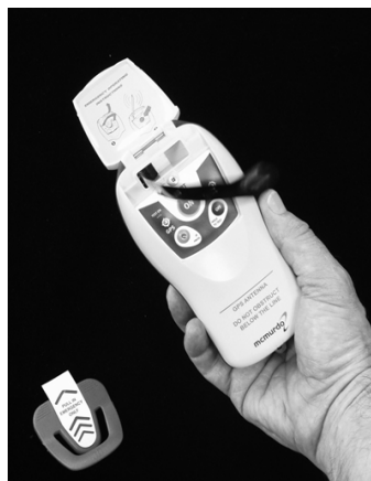
Antennen rullas upp