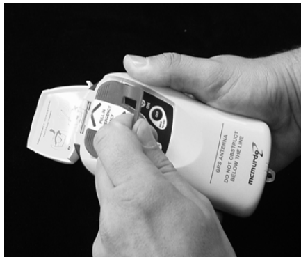
Så här drar man bort den röda plastbygeln. Görs bara vid larm!